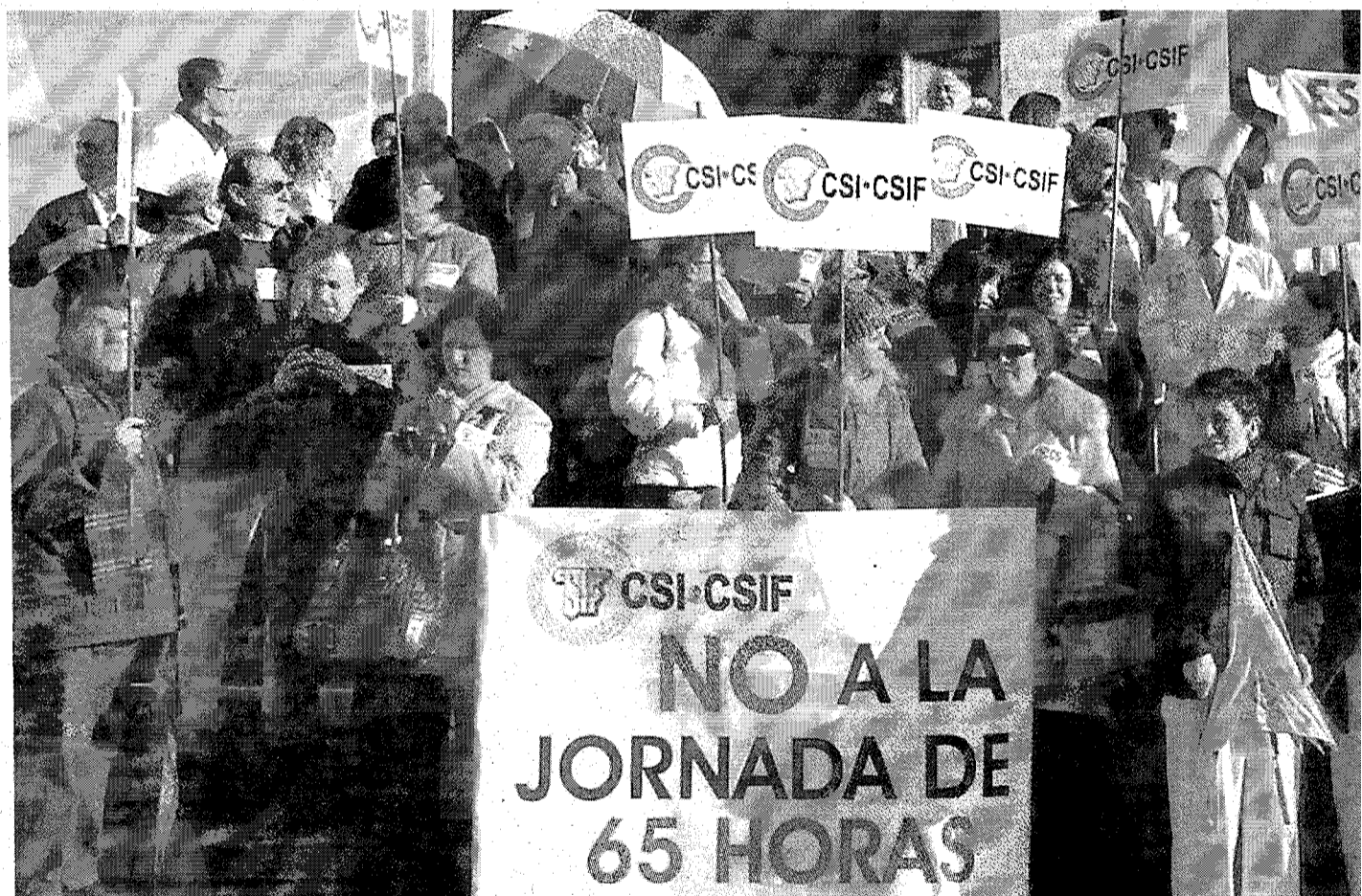
En el hospital Virgen de las Nieves, como en numerosos centros hospitalarios de toda España, hubo ayer un paro rechazando la ampliación de jor