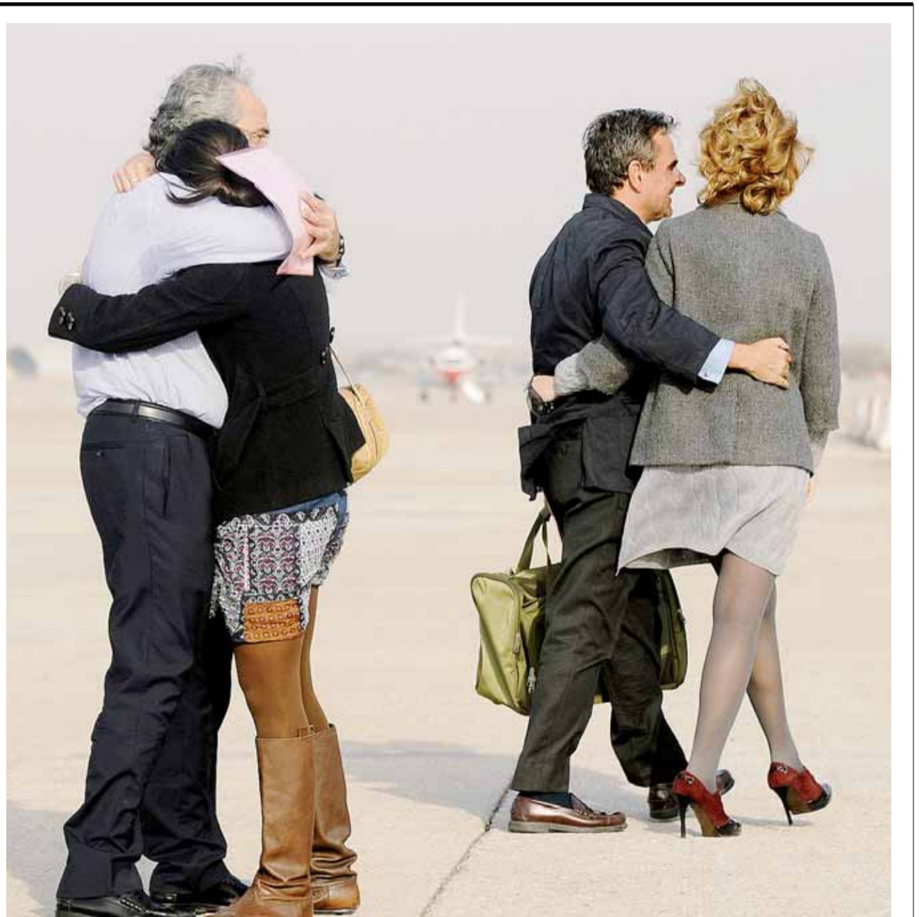
TORREJÓN. Uno de los españoles se abraza a su esposa. Delante, Esperanza Aguirre con otro retornado.

Los secuestros exprés, una modalidad de robo rápido con intimidación y retención de víctimas, no se han producido sólo en calles del centro de la capital. Dos familias de poblaciones del cinturón los sufrieron un mes antes. La Guardia Civil confirmó ayer a IDEAL que investiga dos casos de estas características que tuvieron lugar en septiembre en Albolote y Huétor Vega. PÁG 6