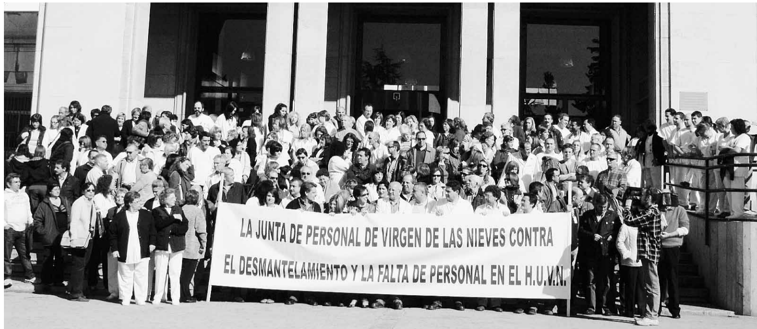
Trabajadores del Virgen de las Nieves en una protesta hace dos semanas.

PLENO MUNICIPAL | 10 | El gobierno local rechaza otra vez ceder los terrenos del ferial a la Junta para construir viviendas VPO