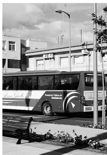
Un autobús de Alsina.