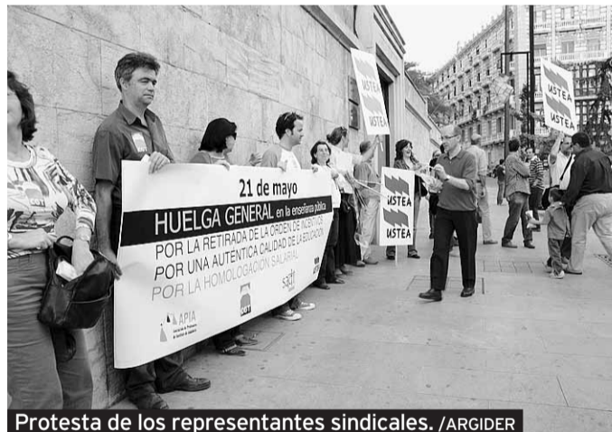
Protesta de los representantes sindicales.