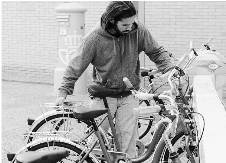
SOBRE RUEDAS. Los universitarios tendrán un nuevo servicio.

El sistema que se utilizará será el mismo que funciona ya en otras ciudades y centros educativos como el de la vecina Málaga, según dijo Moreno. La gente podrá