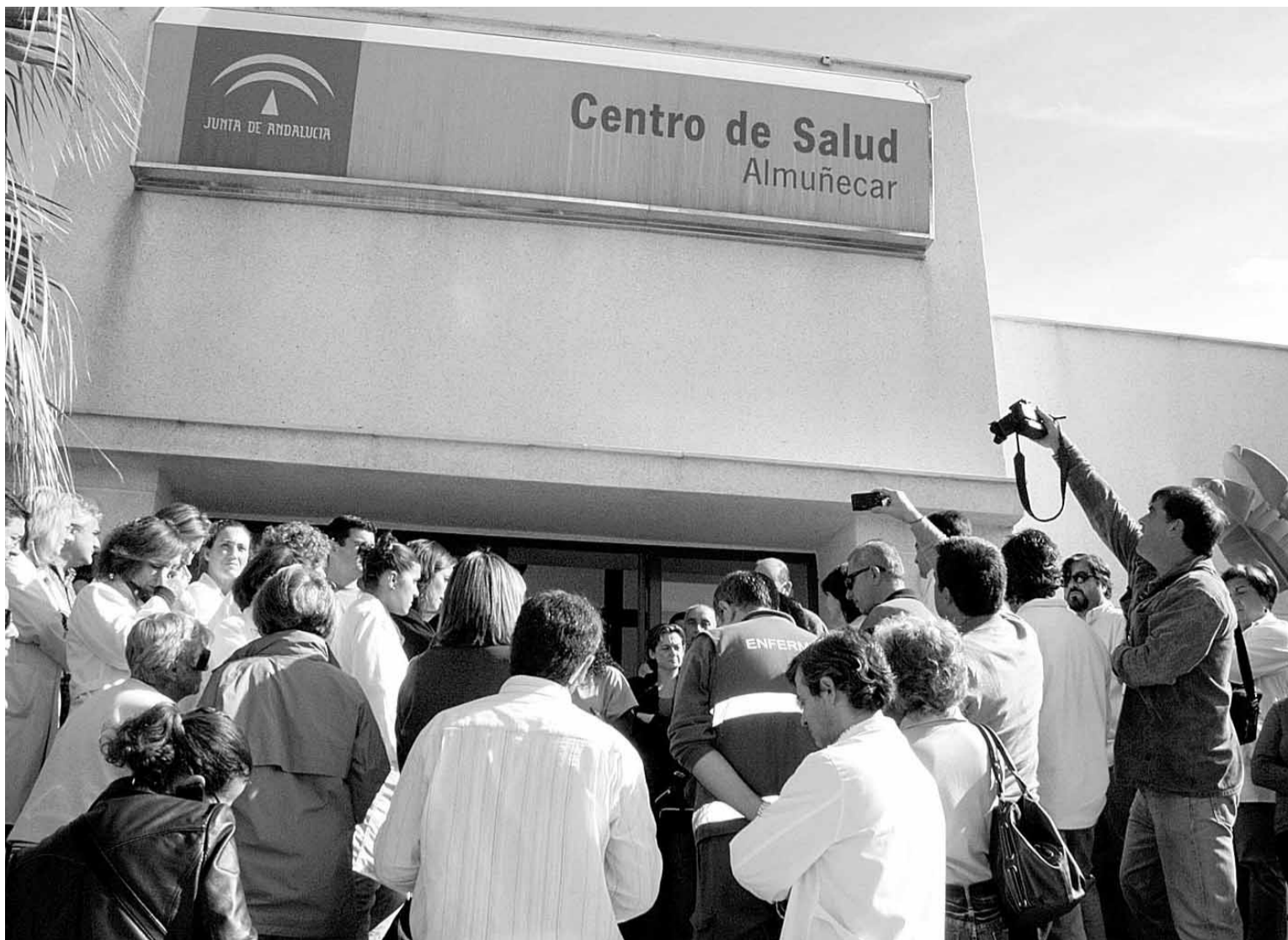
HECHOS UNA PIÑA. El personal del centro y otros miembros del sector sanitario condenan la paliza a sus compañeros.