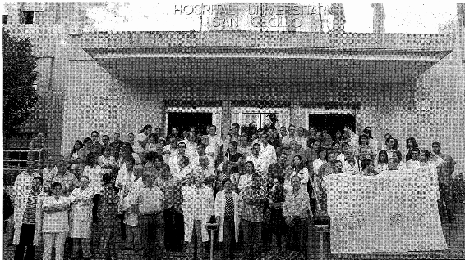
Un centenar de médicos se manifestaron ayer en ante las puertas del Hospital Universitario San Cecilio.