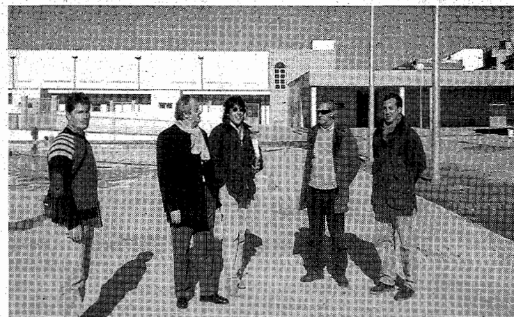
Una comisión municipal visita el centro, que se inauguró en 2006.

comunicó que el Ayuntamiento de Maracena habilitaría unas aulas", relata la madre, quien ha presentado varias instancias a la Consejería. Sin embargo ayer mismo la edil de Educación del municipio le informó de que la Consejería aún no se había puesto en contacto con el Consistorio para adaptar las aulas a las necesidades de niños de 3 años.