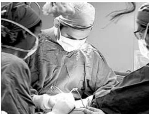
Un equipo de cirujanos durante una operación.

"Llevamos mucho tiempo reivindicando que el Ministerio de Sanidad elabore un plan de recursos humanos que acabe con estas diferencias. Nosotros hemos defendido siempre que el Consejo Interterritorial que se creó