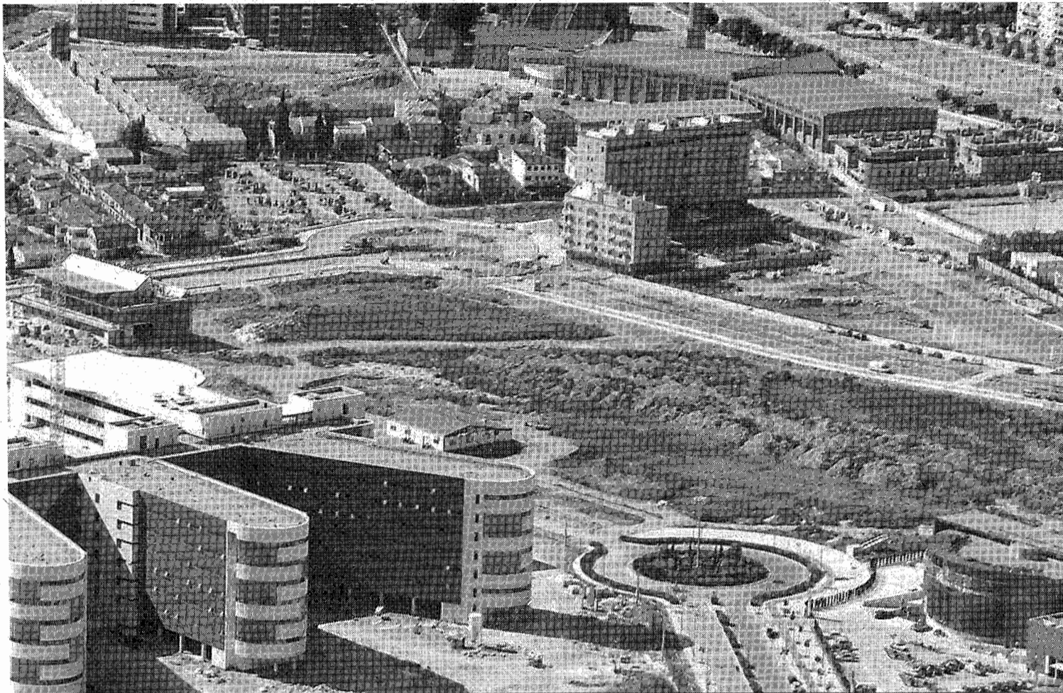
La parcela del PTS destinada al campus universitario está situada junto al Hospital Clínico.