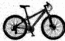
Bicicleta Gotty Alpin-e cuadro de aluminio 7005