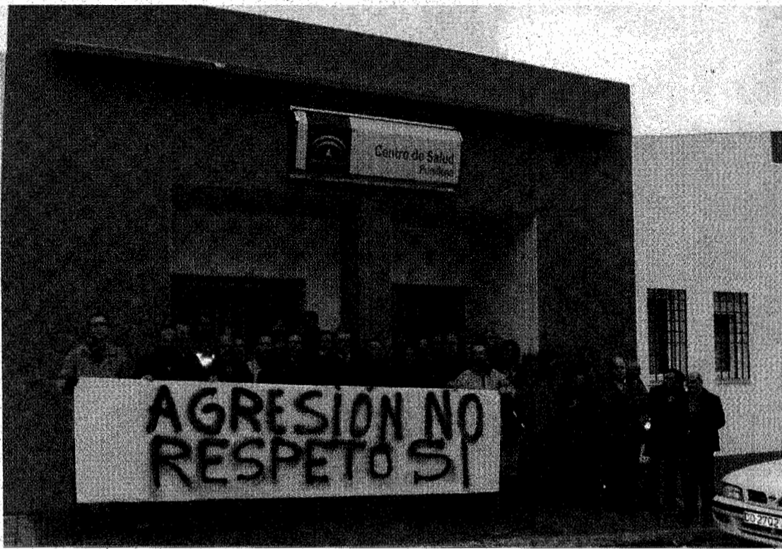
Concentración de los compañeros del facultativo, ayer, a las puertas del centro de Purullena.

El director del Distrito mostró su indignación por lo ocurrido al asegurar que "no podemos dejar de condenar con firmeza la con-