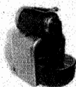
Cafetera Nespresso DeLonghi