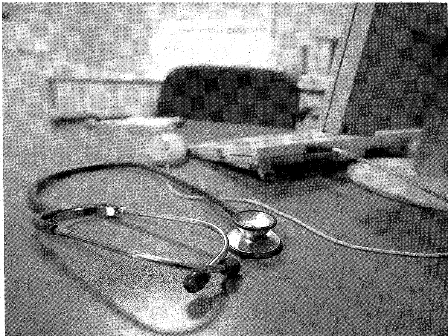
Se espera que en el tramo 2010-2015 se produzcan muchas jubilaciones en la provincia.

“Y se prevé que en el tramo 2010-2015 sean muy acentuadas