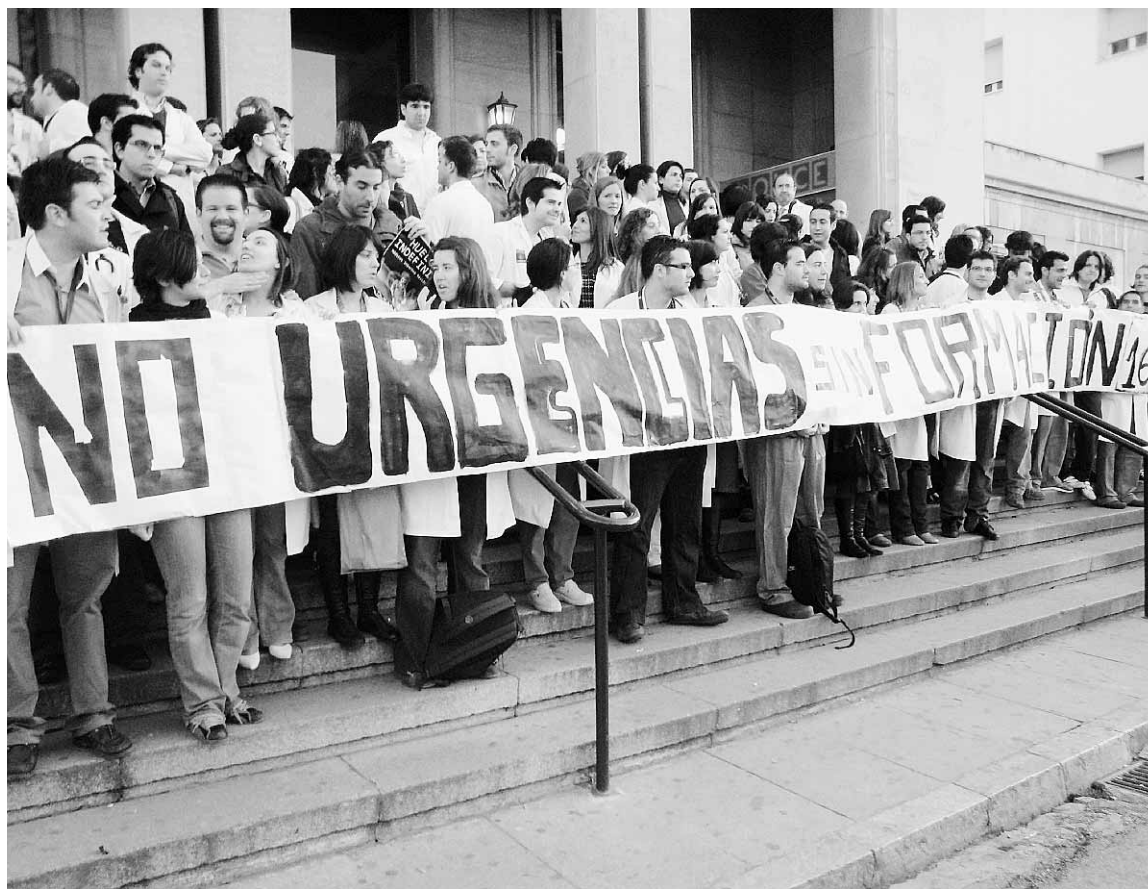
La concentración mantenida ayer por los MIR del Hospital Virgen de las Nieves.

Los médicos en formación del Virgen de las Nieves consensuaron ayer con la delegación provincial de Salud los servicios mínimos para la huelga indefinida que secundarán a partir del lunes. El viernes habrá un portavoz de los