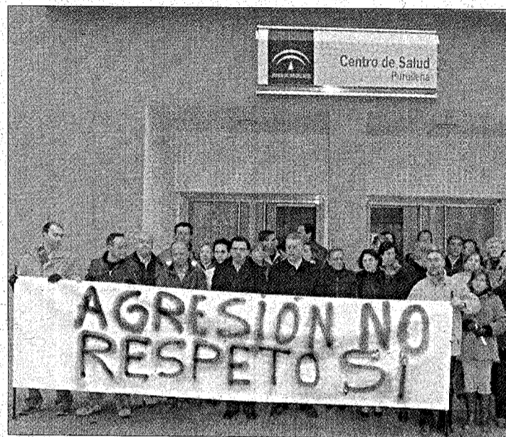
Condena. Concentración ante el centro de salud de Purullena.