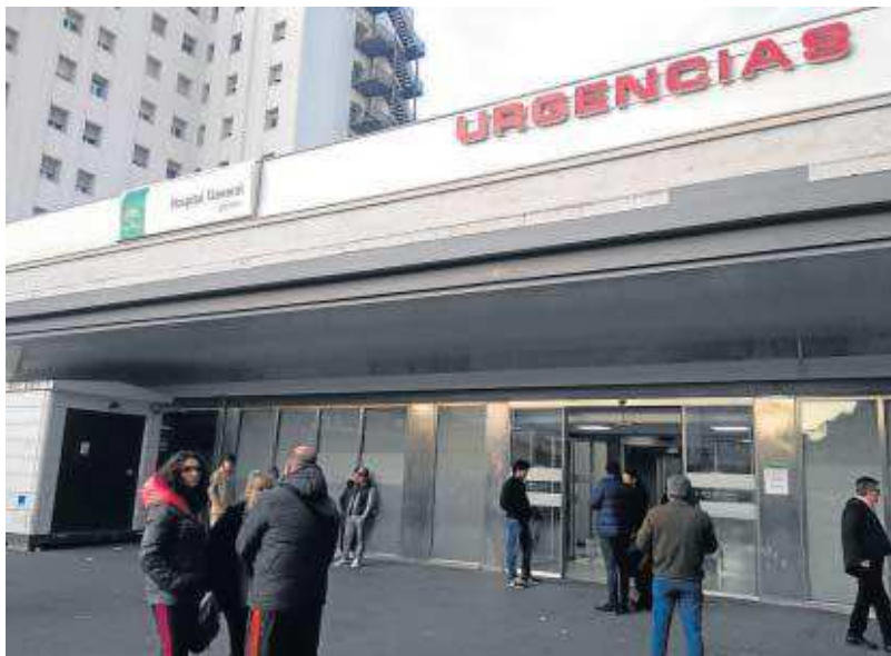
Imagen de las Urgencias de Ruiz de Alda, perteneciente al Virgen de las Nieves.

A la luz de esta reclamación que apunta a la base del problema y que constituye la raíz de los motivos de huelga de los MIR, los médicos adjuntos del Hospital Cam-