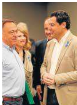
Juanma Moreno, ayer en Cádiz.

Las propuestas del PP giran en torno a varios puntos esenciales.