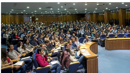
Futuros residentes durante un acto de adjudicación de plazas MIR

El número de vacantes disponibles para los que se examinen en 2019 crece un 4,4 por ciento, hasta las 6.797 plazas de posgrado.