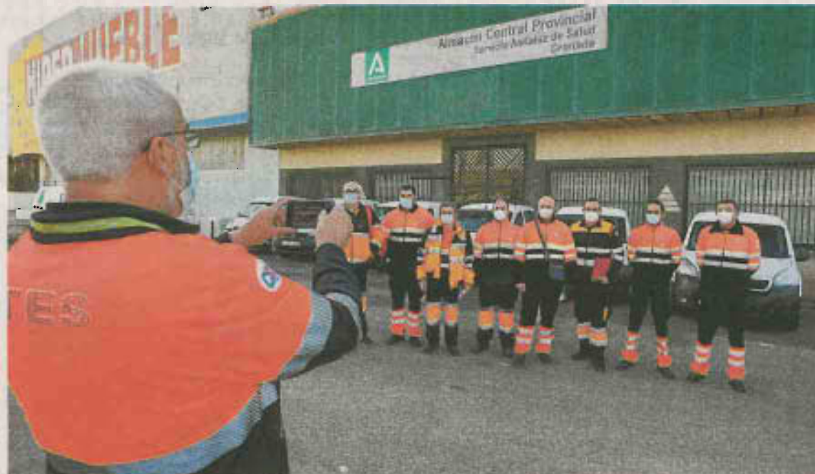
Los encargados de transportar las vacunas immortalizan el histórico domingo.

En este sentido, ha explicado que en el día de ayer se comenzaba a administrar la cantidad simbólica de 1.900 vacunas. A partir de este lunes, tal y como se ha comprometido el Gobierno de la Nación a través del Ministerio de Sanidad, llegarán a la comunidad semanalmente un total de