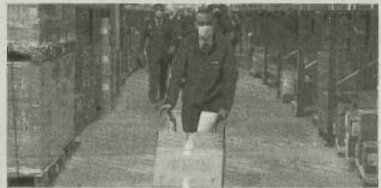
Momento de la llegada de las vacunas a Atarfe. E. P.