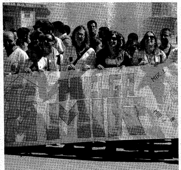
Protesta de los MIR el pasado martes.

Los MIR realizarán una nueva propuesta para la dirección "con números sobre la mesa, es decir, viendo la viabilidad de cada propuesta contando con la plantilla existente y cumpliendo con su programa de formación".