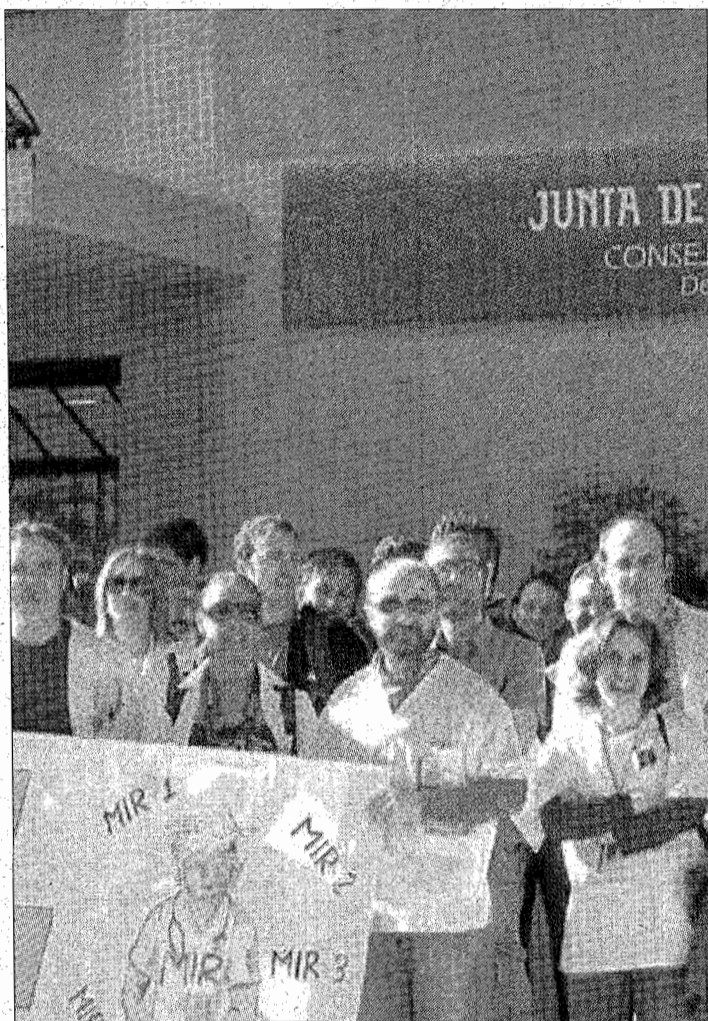
Los MIR se concentraron ayer en la puerta de Salud.