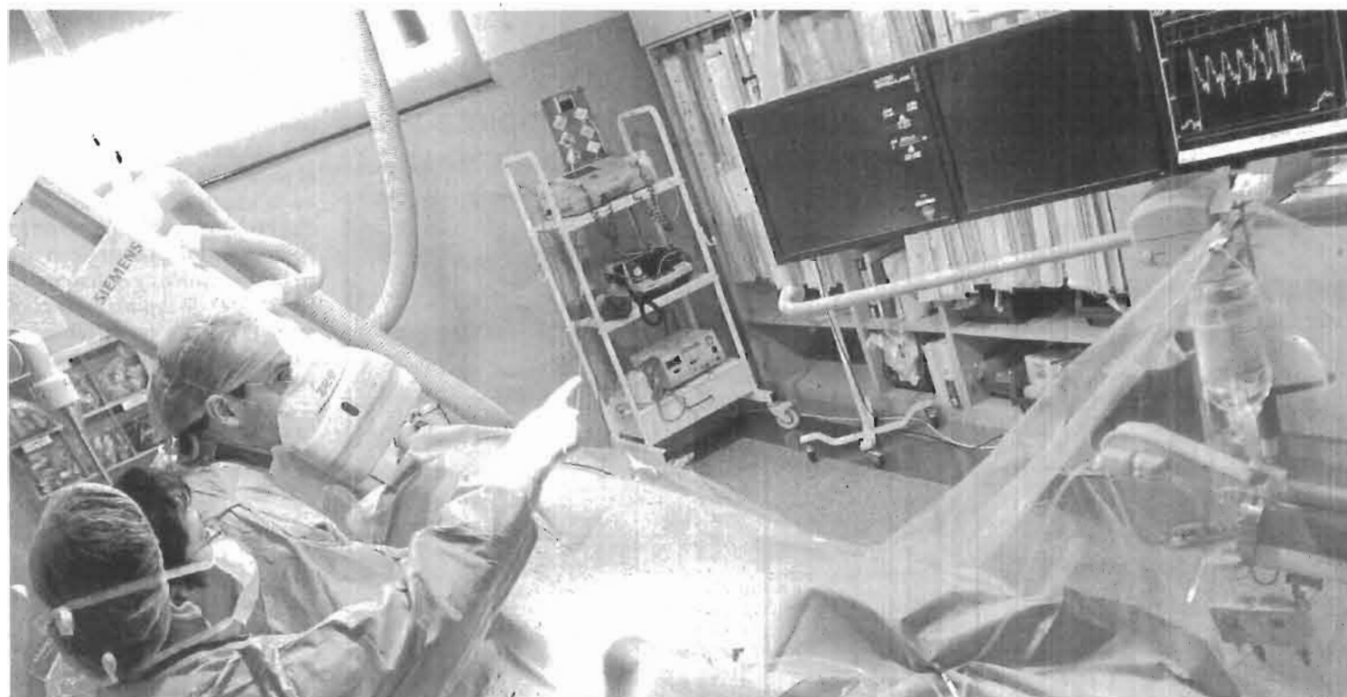
Los costes varían en función del personal, recursos, pruebas, fármacos y hospitalización.

La restauración del Palacio de Dar al-Horra, residencia de la madre de Boabdil, retira de sus muros más de 200 grafitis