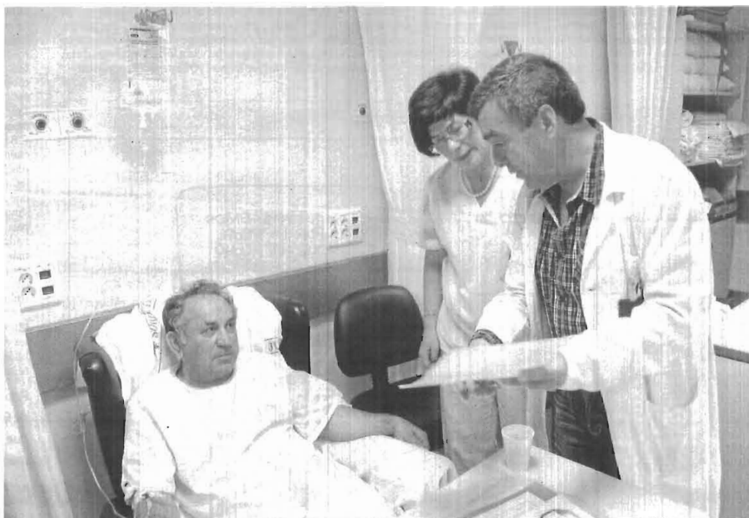
El hospital Santa Ana de Motril fue el primero de la provincia en dar las facturas a los pacientes.

El procedimiento consiste en que el propio personal médico o de planta informa a los pacientes del significado de esta factura y le entrega el documento. Es una carta en la que se dice en un primer párrafo que esperan que "haya recibido un servicio sanitario de calidad y se haya sentido cómodo durante el tiempo que ha durado su ingreso". Después justifican la medida y añaden: "En su caso, la asistencia sanitaria prestada en este centro hospitalario con fecha XX/XX/XXXX ha ocasionado un gasto por el siguiente concepto (por ejemplo, operación de hernia). Una vez aplicados todos los recursos materiales y humanos dedicados a su tratamiento o proceso dicha asistencia ha tenido un coste estimado de XXXX euros, en