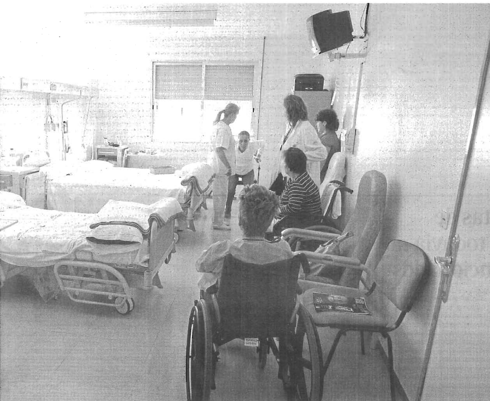
Los ingresos pueden ser urgentes o programados para intervenciones o tratamientos.

El pleno municipal aprueba la congelación de las nóminas de los concejales y el recorte de 14 puestos de confianza.