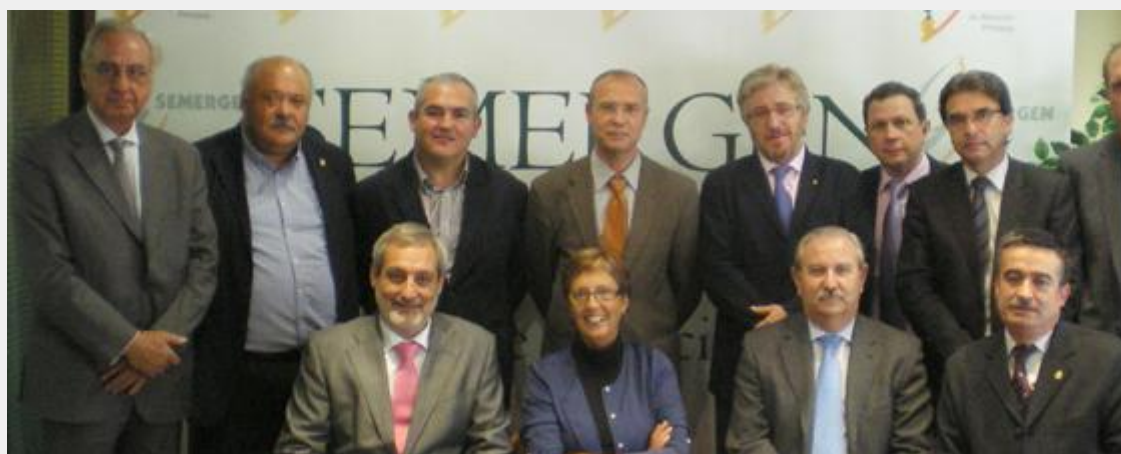
Imagen de uno de los encuentros del Foro de Médicos de Atención Primaria en la sede de Semergen.

La celebración de la I Conferencia Nacional de Atención Primaria (AP) representa una oportunidad única para que el primer nivel asistencial debata, junto al Gobierno y las comunidades autónomas, la importancia de abordar reformas y darle al sector la importancia que se merece. La conclusión general de los integrantes del Foro de Médicos de AP horas antes de comenzar la Conferencia ha sido la de mostrarse “satisfechos” por la organización del encuentro, de carácter anual, tras poco más de un año de trabajo.