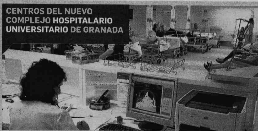
CENTROS DEL NUEVO COMPLEJO HOSPITALARIO UNIVERSITARIO DE GRANADA

Ahora se da autorización a la gerencia de los hospitales para que ejecute ese plan de personal necesario para la fusión de los hospitales y el traslado de centros según el