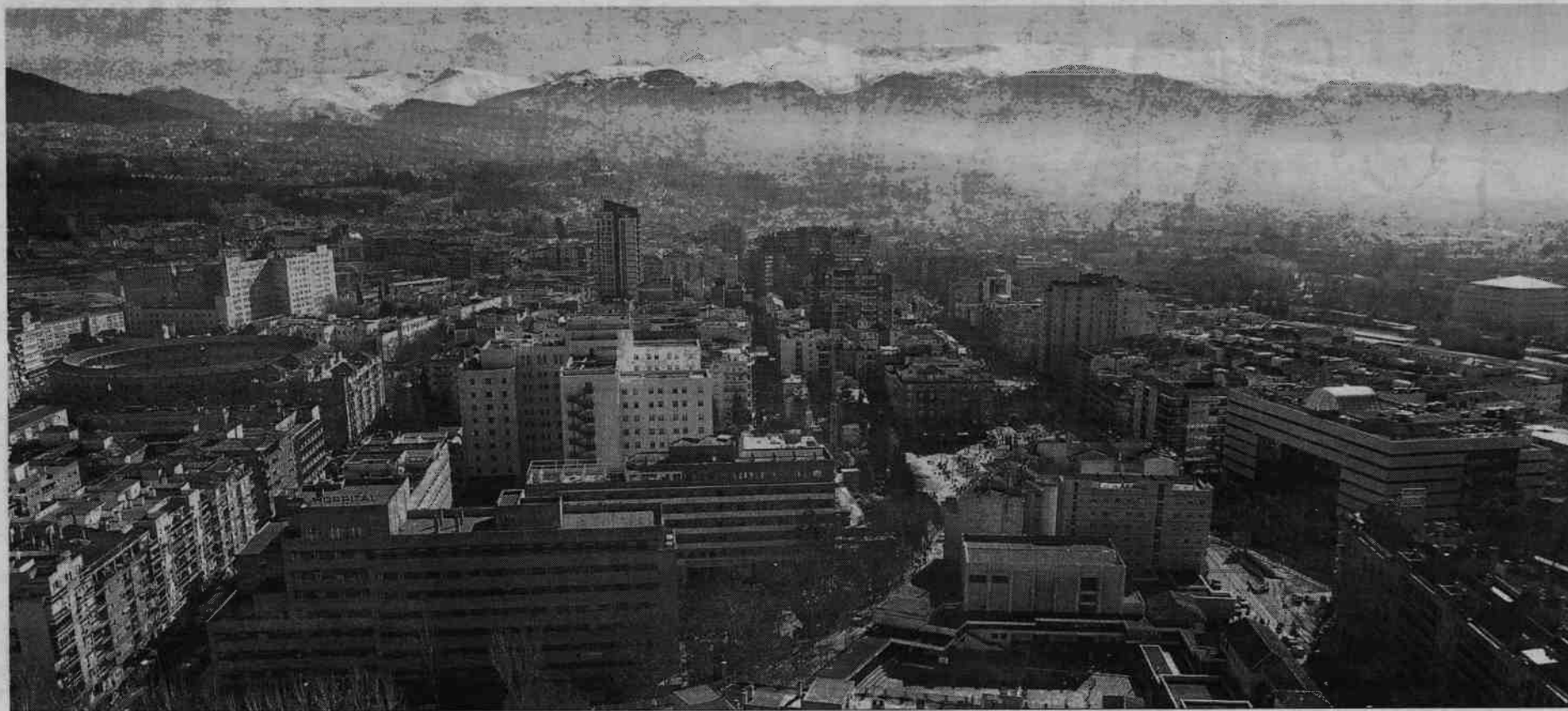
Imagen en la que se aprecian los hospitales Materno Infantil, el Virgen de las Nieves y el Clínico.

rios de antigüedad, pertenencia a la Unidad de Gestión Clínica, etcétera para dirimir la resolución.