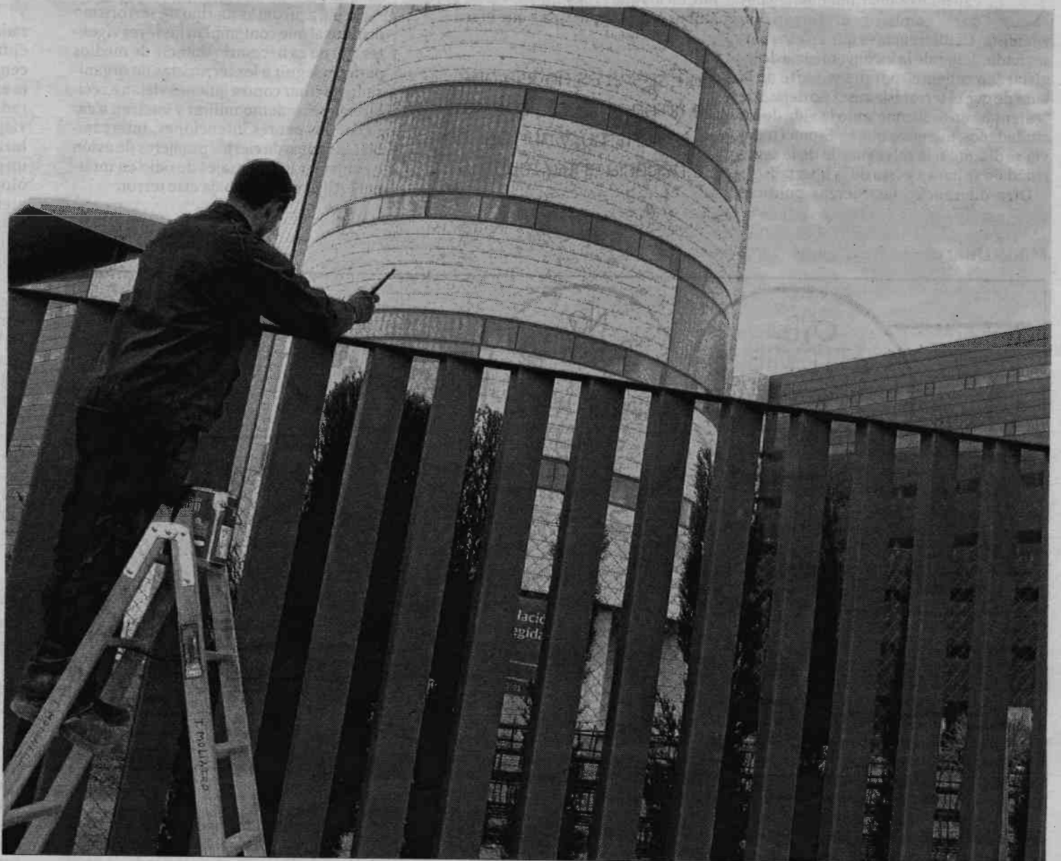
Ayer se daban los últimos retoques a la nueva valla que fija el perímetro del recinto.

Será hoy cuando los técnicos municipales se pongan en con-