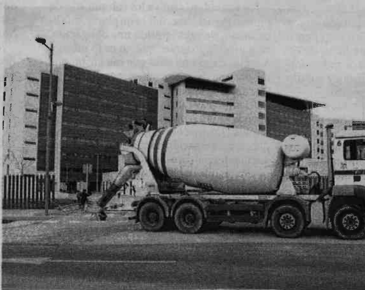
El movimiento estos días no cesa para poner a punto el acceso.