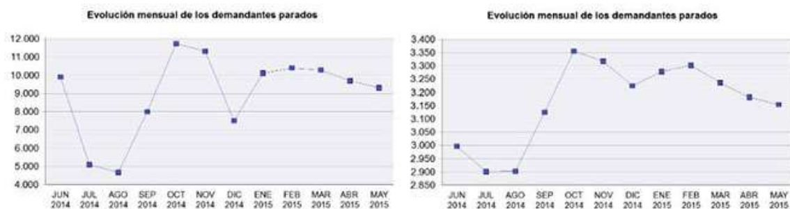
Evolución del desempleo en Enfermería (a la izquierda) y en Farmacia (a la derecha).

En cuanto al número de contratos, el SEPE informa que se firmaron durante el mes de mayo un total de 532, un 6,82 por ciento más que en abril pero un 9,37 por ciento menos que en mayo de 2014.