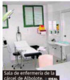
Sala de enfermería de la cárcel de Albolote.