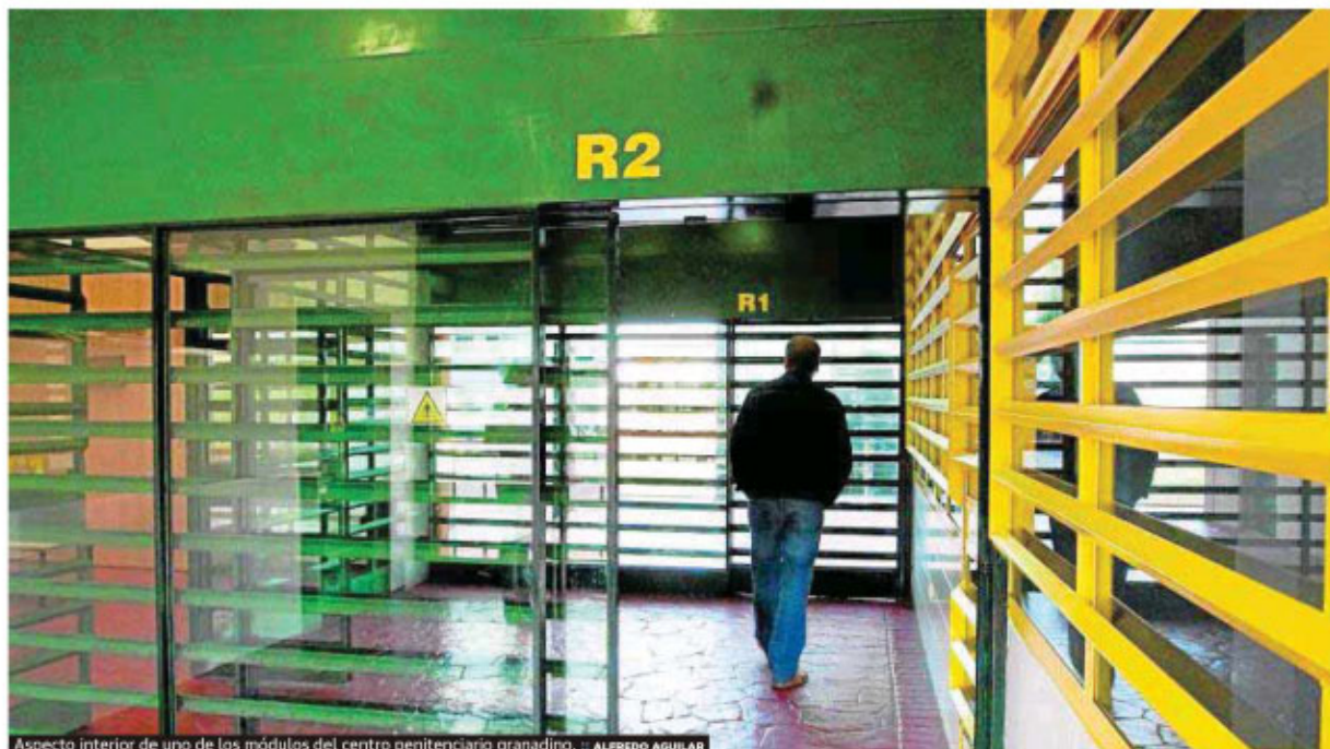
Aspecto interior de uno de los módulos del centro penitenciario granadino.