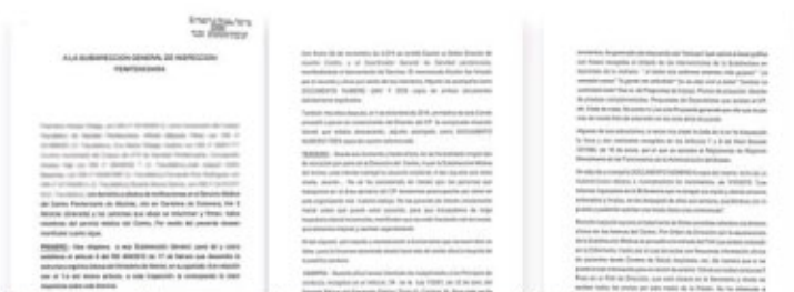
Los documentos internos que acreditan el malestar existente en Albolote.

un subsidio de algo más de 400 euros y busca trabajo. «Tengo módulos de jardinería, tapicero y panadero, pero no me sale nada, así que vivo con mi madre», explica el agradecido protagonista mientras anda por el Rincón de la Victoria (Málaga), donde vive.