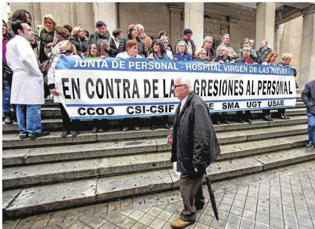
Protesta ayer en el Virgen de las Nieves, donde la Junta de Personal se quejó del incremento de agresiones a los sanitarios.

La cuestión, según denunció ayer la Junta de Personal del Virgen de