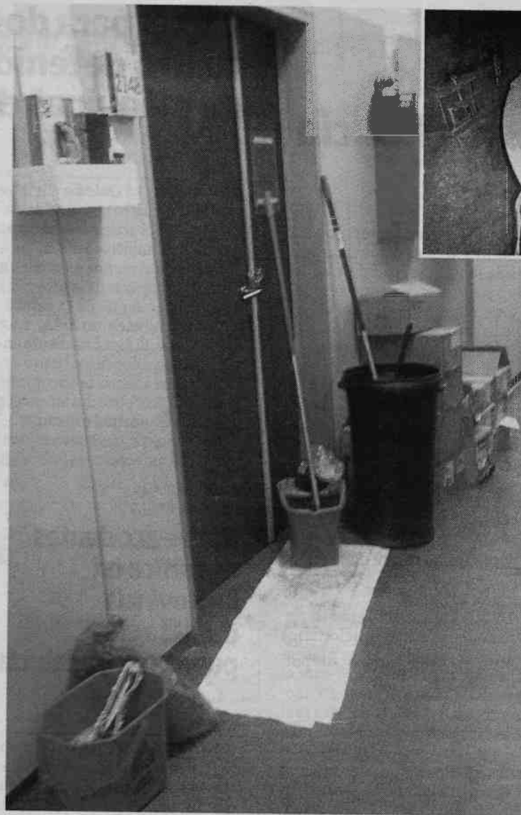
La habitación permanecía ayer cerrada con un candado. ✉ A. P.

IDEAL recibió ayer las imágenes del área quemada, donde el personal de mantenimiento acudió a extinguir el fuego antes de que llegaran los efectivos de seguridad y de que se diera aviso al ingeniero de guardia. Según fuentes del servicio técnico, «el percance se produjo por la instalación en un aseo sin ventilación de un aparato de calor poco seguro que los empleados ya habíamos denunciado. Esa zona es una ratonera, de habitaciones pequeñas y sin salida de evacuación de fondo». Los portavoces del hospital no esgrimieron las causas del siniestro, que sólo acabó con daños materiales. «Por allí también ardió la máquina de frío-calor hace año y medio y su mantenimiento era de la misma empresa privada», dijo uno de los técnicos.