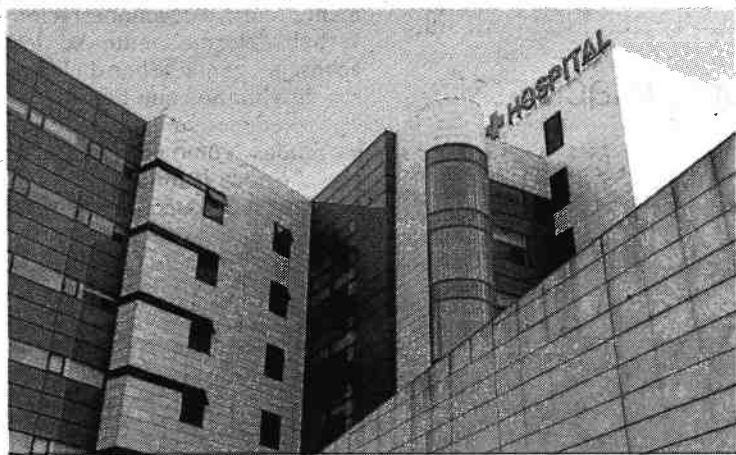
El cartel del hospital ya está colocado.