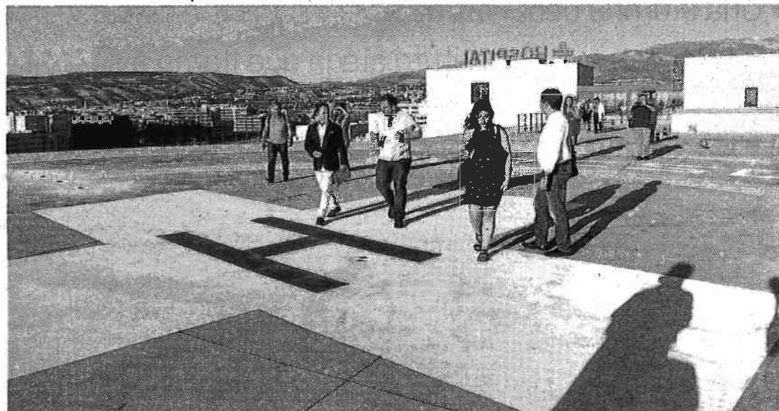
El helipuerto ha pasado ya las pruebas de seguridad.