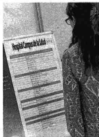
Las consultas ya funcionan.

La visita se está realizando para enseñar un ejemplo de cada área del hospital, dividido en zona de hospitalización (las tres patas redondeadas), de consultas y bloque quirúrgico. Las habitaciones están a la espera de vestir las camas y ubicar a los pacientes. Son todas (más de 300) individuales o dobles (hay