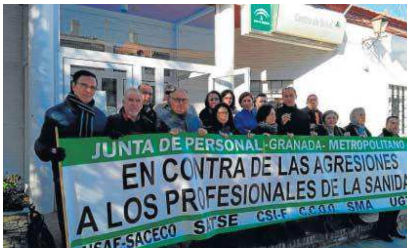
Imagen de la concentración celebrada ayer en el centro de salud de Iznalloz.

Los sindicatos de la Junta de Personal han pedido también más medidas para luchar contra las agresiones, aumentar la concienciación ciudadana y proteger al personal. La agresión física o intimidación grave contra profesionales sanitarios en el ejercicio de su función pública asistencial viene recogida en el Código Penal como delito de atentado contra la autoridad.