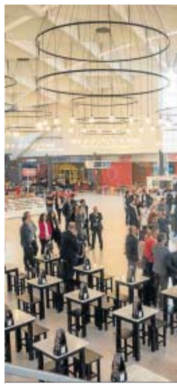
Centro Comercial Granaita.

Permanecerán cerradas las zonas infantiles o recreativas y las zonas de comunes; si hay puestos de información, tendrán que instalarse mamparas de metacrilato y establecer un