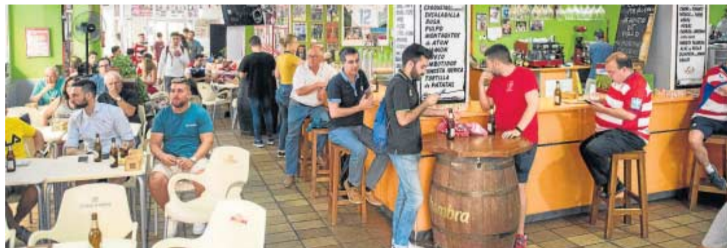
Los bares podrán abrir sus interiores, aunque no como en la imagen, sino manteniendo distancia de seguridad y aforo limitado.

En cuanto a la cantidad de personas que podrán asistir a misas, velatorios y entierros, se amplía el aforo máximo permitido hasta el 50%, manteniendo las mismas medidas de seguridad e higiene especificadas para la fase 1. Además, se debe poner a disposición del público dispensadores de geles hidroalcohólicos o desinfectantes a la entrada.