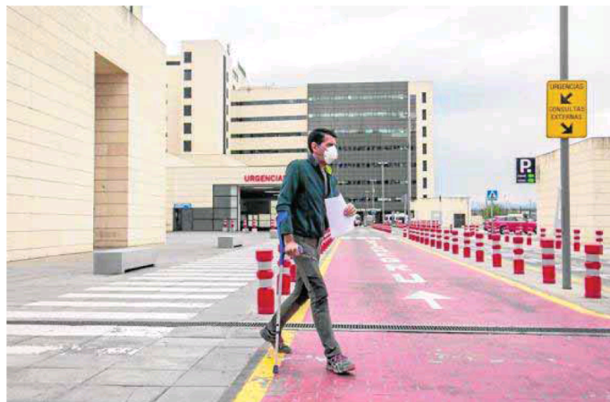
Un hombre pasa por delante del hospital Clínico San Cecilio.

El horizonte en diciembre era recuperar el 100% de las operaciones si lo permitía la pandemia, que al final no ha dado margen